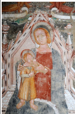
La Madonna del latte nella chiesa di S. Stefano

Quello del 2020 sarà un mese di maggio diverso dai precedenti a causa delle restrizioni necessarie a contrastare il contagio da Covid19; per questo la Comunità Pastorale Beato don Carlo Gnocchi e le parrocchie di Bizzozero che di essa fanno parte, ha previsto delle iniziative che - nel rispetto delle disposizioni